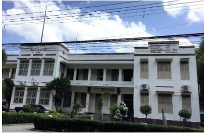
อาคารเรียน ตึก 1