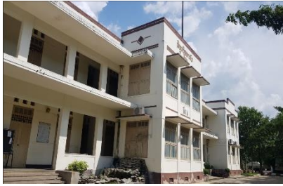
อาคารเรียน ตึก 2