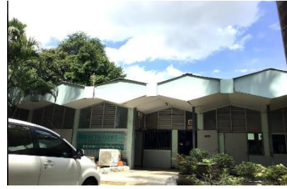
อาคารเรียนเกษตรกรรม