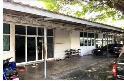
อาคารเรียน ดนตรี