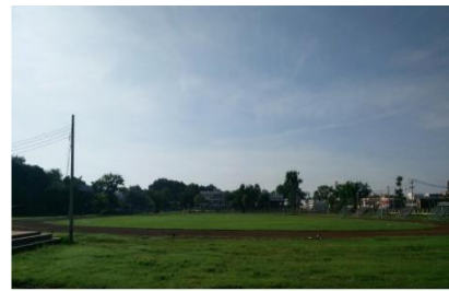
สนามกีฬา-สนามฟุตบอล แบบ ฟ.3(พิเศษ)