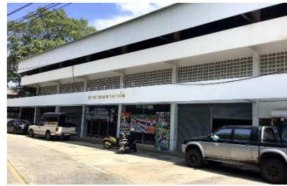
สนามกีฬา-โรงยิม