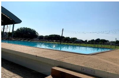
สนามกีฬา-สระว่ายน้ำ