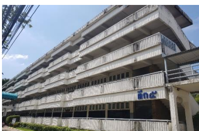
อาคารเรียน ตึก 5