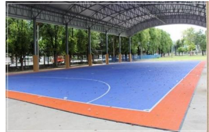
สนามกีฬา-สนามฟุตบอล