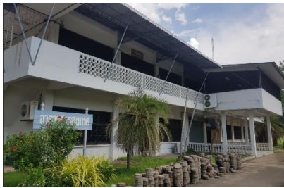
อาคารเรียนคอมพิวเตอร์