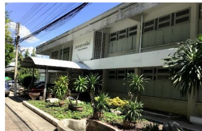
อาคารเรียนคหกรรม