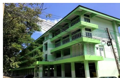
อาคารเรียน ตึก 7