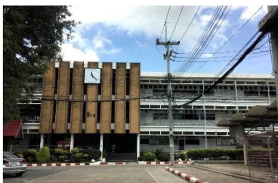
อาคารเรียน ตึก 4