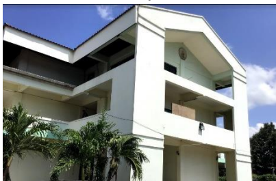
หอประชุมวิชาเขนทร์