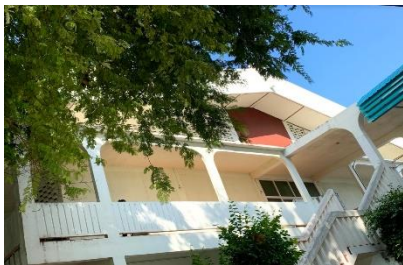
หอประชุมพินุลสงคราม