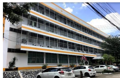
อาคารเรียน ตึก 6