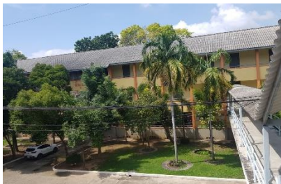
อาคารเรียน 3