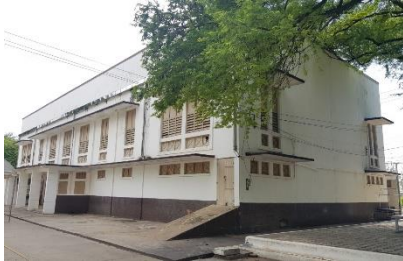
หอประชุมกุ่มมสโร